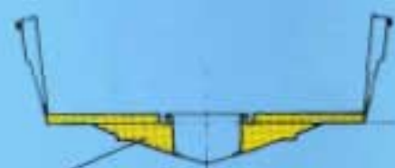
Schnittansicht mit zentraler Komponente aus Polystyrol - unzerstörbar, leicht, verfallendes Cockpit, Schotbolz